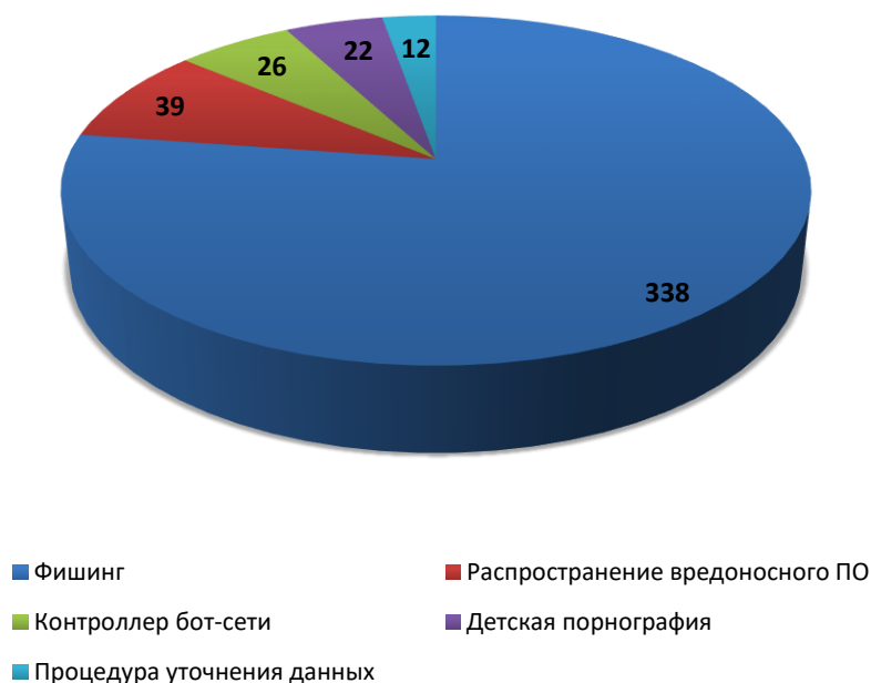
Рис.2 Распределение доменов по видам вредоносной активности (март 2020)

За отчетный период по обращениям компетентных организаций были сняты с делегирования 362 доменных имени. Для 9 доменных имен снятие делегирования не потребовалось вследствие оперативного устранения причин блокировки администратором домена или своевременного подтверждения администратором домена идентификационных данных. В 24 случаях, снятия делегирования не потребовалось, так как ресурс был заблокирован хостинг-провайдером. В 19 случаях, регистратором не усмотрено достаточно оснований для снятия делегирования или инициирования проверки администратора. На момент подготовки отчета, 35 обращений находились в статусе обработки.